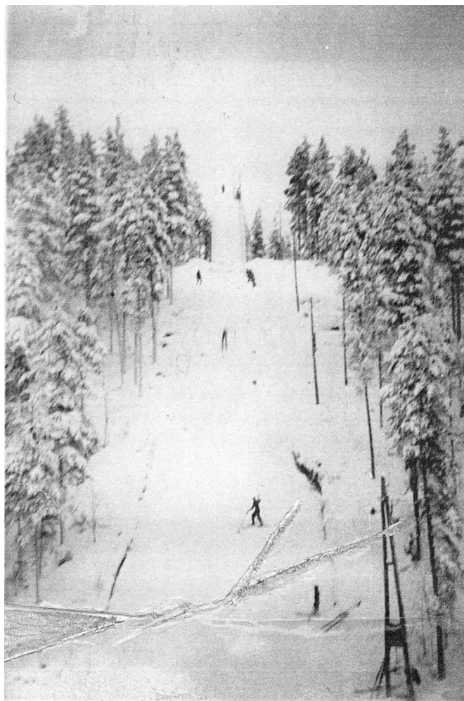
Ruuhijärven 45 m hyppymäki 40-luvulla. Huomaa mäen nykyaikainen valaistus.