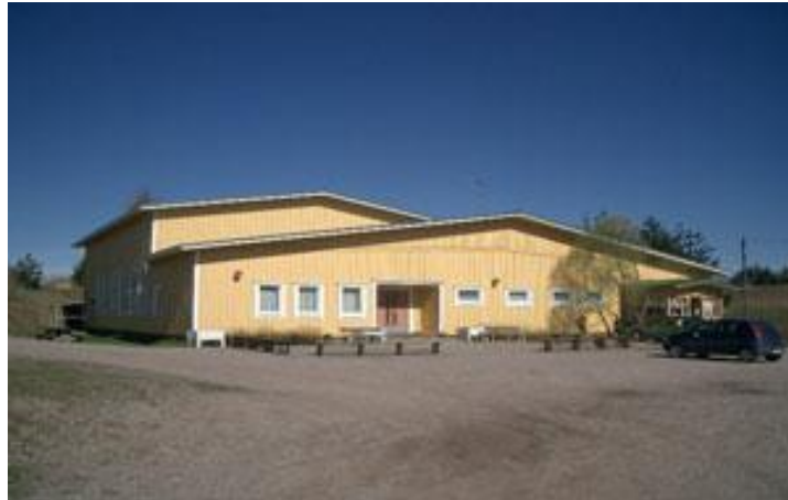
Ruuhijärven nykyinen seurantalo valmistui talkoilla 1979